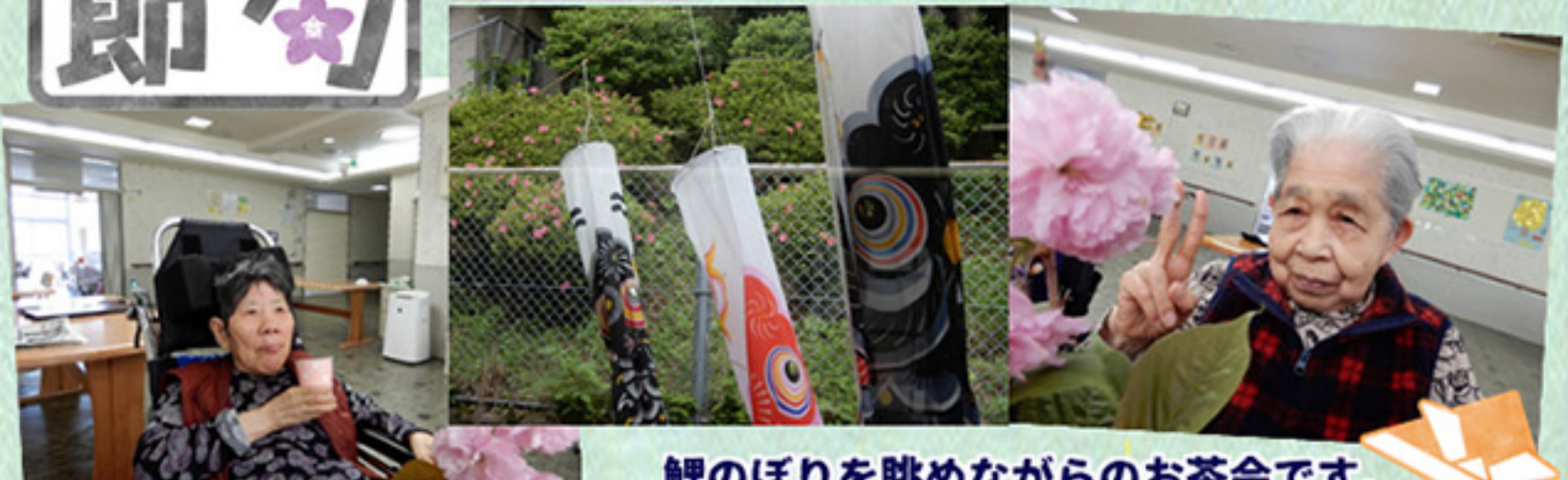
鯉のぼりを眺めながらのお茶会です。