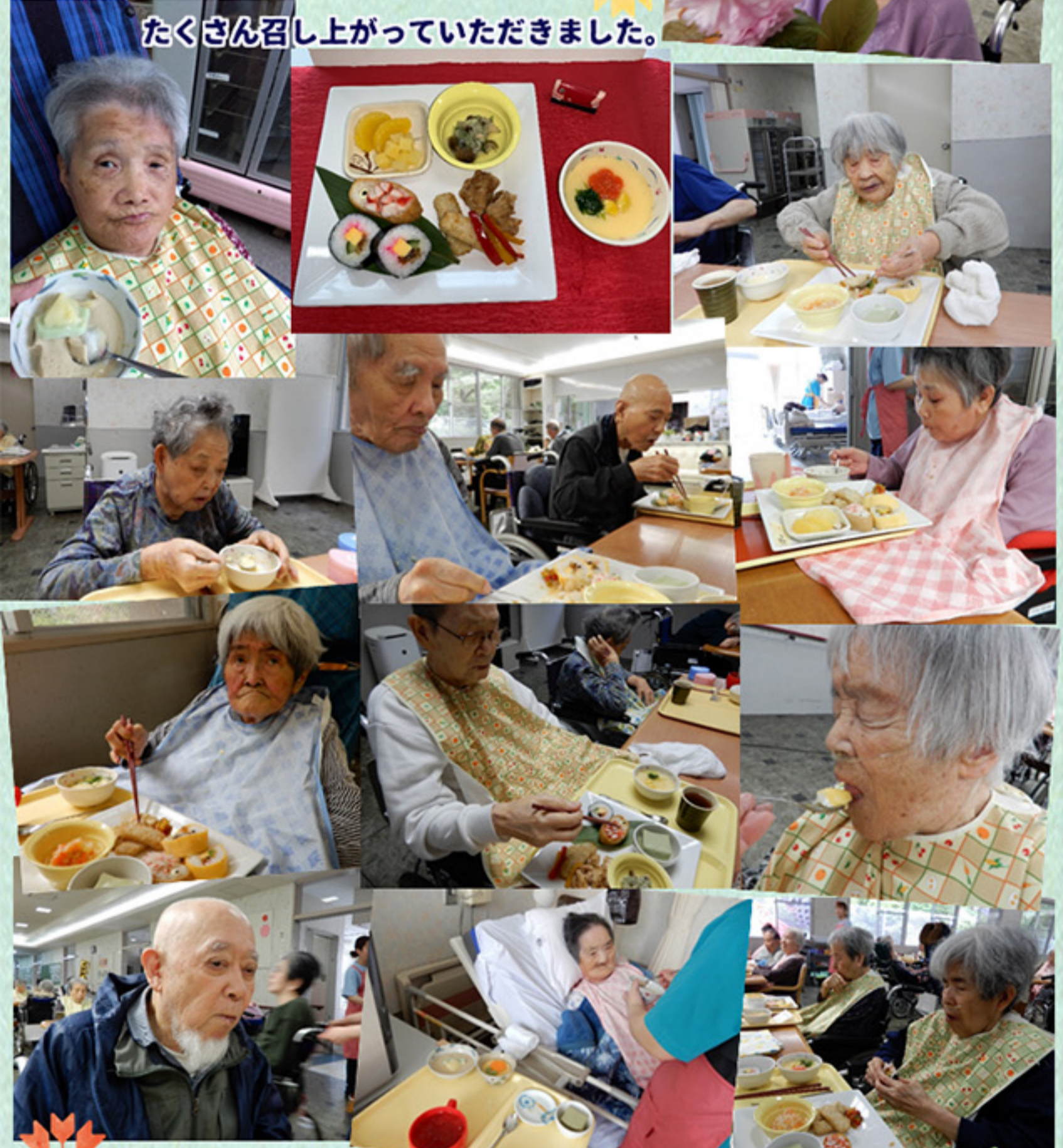
おやつには感嘆の声が上がりました。