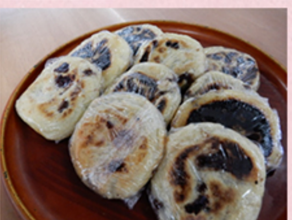
白玉粉と豆腐で作る生地は 柔らかく歯にもつきません。