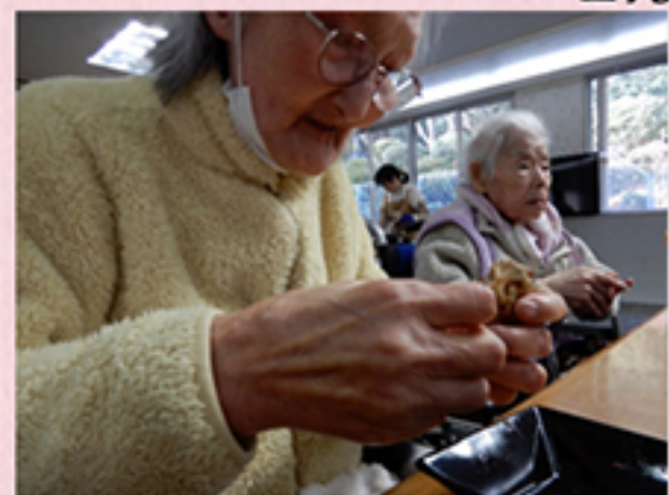
焼きたてを食べていただきます。