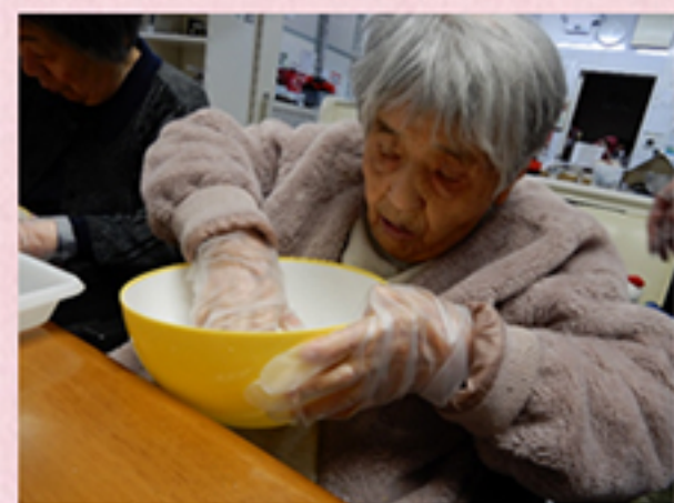
生地をコネコネして