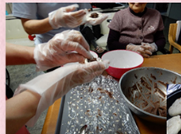
スタッフもお手伝い。