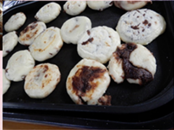
こんがり焼きあげます。