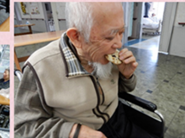
甘い物は大人気です。