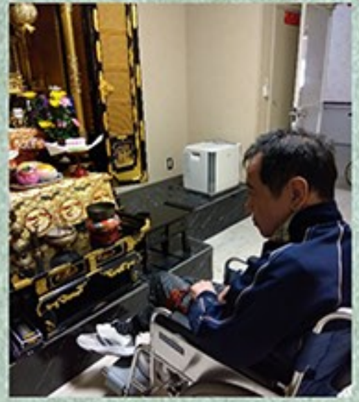
「暑さ寒さも彼岸まで、・・・春がやって来ました。」