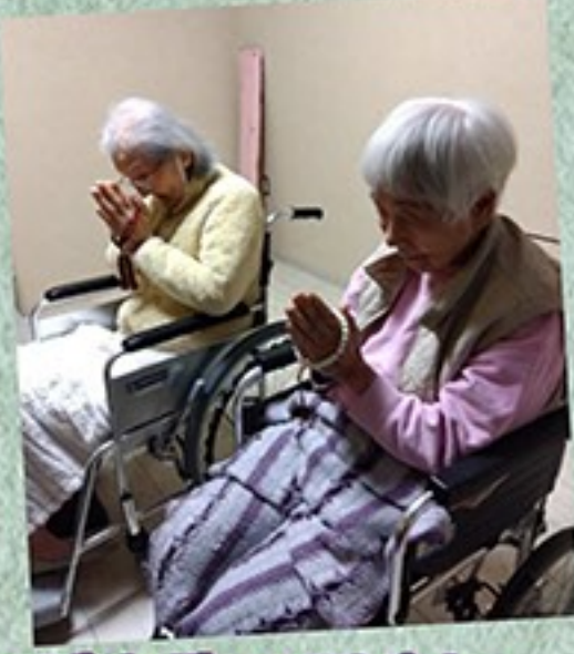
こ先祖様のご供養を。